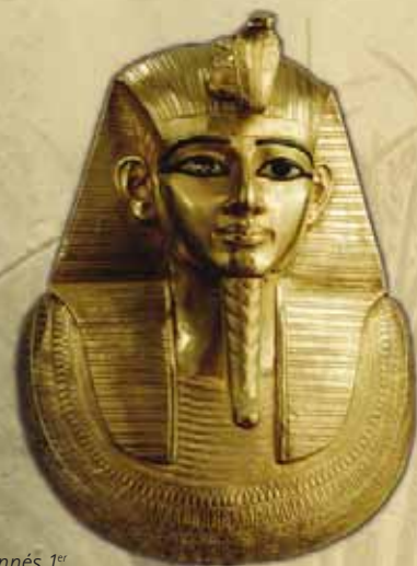
Masque funéraire de Psousennés 1 er

Le Cercle a pour objectif de favoriser l'information, le dialogue et le partenariat entre BNP Paribas et la communauté de ses actionnaires. La vie du Cercle vient donc compléter La Lettre financière ; elle vous propose de participer à des manifestations culturelles, à des formations et à des réunions d'information. L'adhésion au Cercle est automatique pour les actionnaires détenteurs en début d'année, sur un ou plusieurs comptes du même foyer, d'au moins 200 titres BNP Paribas.