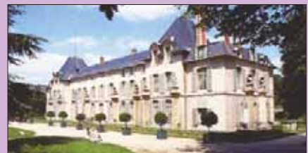
Le château de Rueil-Malmaison