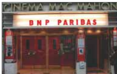
Cinéma du monde au Mac-Mahon