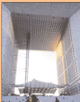
La Grande Arche de la Défense