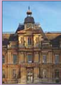
Le château de Maisons