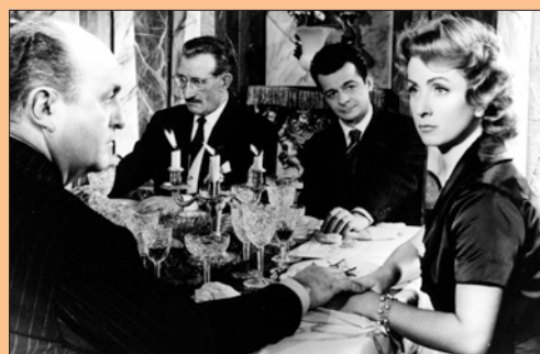
"Marie-Octobre" de Julien Duvivier