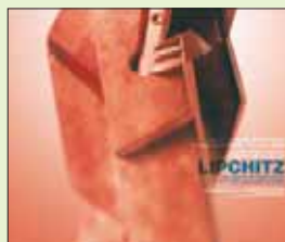
Sculpteur Jacques Lipchitz