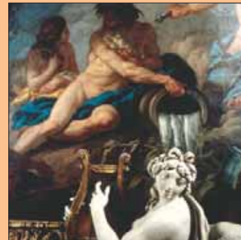
Galerie d'Apollon après restauration 2004 - détail