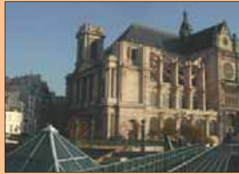
L'église Ste Eustache - Les Halles

Le "ventre de Paris", appellation classique au XIX ème siècle, date de l'époque où cet ensemble a été rénové par Baltard. Ce marché a été créé par Philippe-Auguste à la fin du