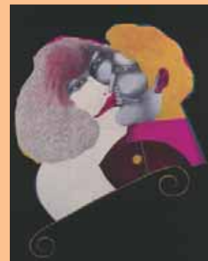
Kiss - Lindner