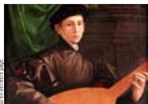
© en dernière partie

Au XVI e siècle, l'art du portrait devient de plus en plus répandu parmi les élites florentines, qui trouvent là un moyen de porter leur visage et leur statut social à la postérité. L'exposition présente des chefs-d'œuvre de Pontormo, élève d'Andrea del Sarto et maître du maniérisme, et donne l'occasion d'apprécier les traits raffinés et gracieux, typiques des portraits de Bronzino ou ceux de Salviati témoignant d'un sens achevé de la sophistication.