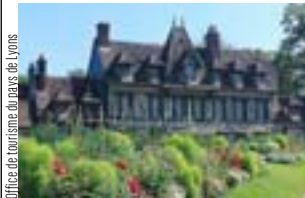
Office de tourisme du pays de Lyons

L'architecture de Lyons-la-Forêt a été merveilleusement conservée. Le village, classé parmi les plus beaux de France, fut un haut lieu de l'histoire ducale de Normandie. Les maisons, monuments, châteaux, abbayes... nous replongent dans cette époque.