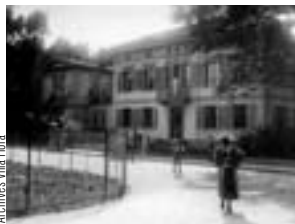
Archives Villa Flora