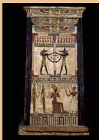
Coffret d'Hetepimen - Musée du Louvre, Département des Antiquités Égyptiennes bois