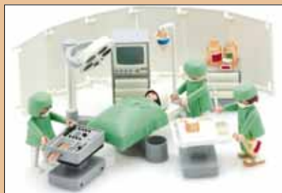
Salle d'opération, Playmobil, Allemagne, 1992

Pompier, maîtresse d'école, vétérinaire, policier... À cette question rituelle posée par les adultes, les enfants perspicaces répondent par un métier, qui