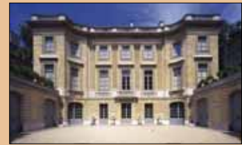
L'hôtel particulier commandé par Moïse de Camondo