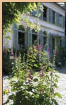
Le Musée de la Vie romantique dans le quartier de la Nouvelle Athènes