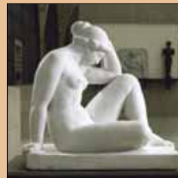
Aristide Maillol (1861-1944) Méditerranée dit aussi La Pensée Entre 1923 et 1927 - Marbre Paris, musée d'Orsay