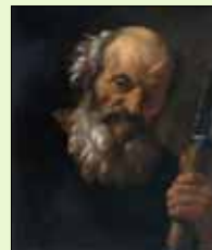
Saint Simon, Attribué à Simon Vouet