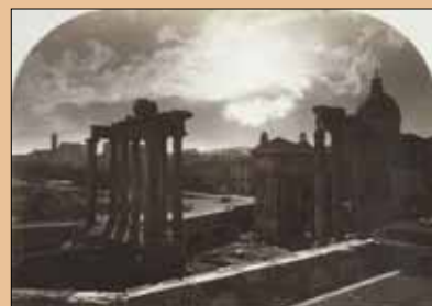
Gioacchino Altobelli - Rome, le forum romain au soleil couchant - Vers 1866 - Épreuve sur papier albuminé. Collection Siegert © Droits réservés

À partir du 6 mars, date précisée ultérieurement – n°164