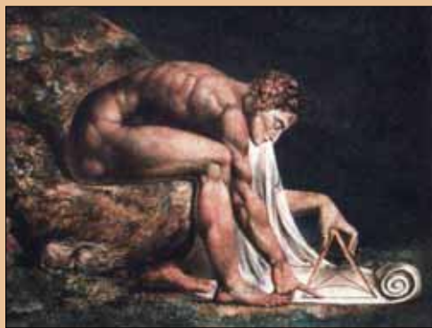
William Blake - Newton, 1795