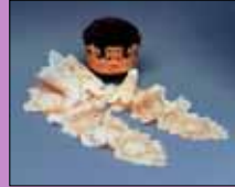
Barbes de la reine Louise née princesse de Hanovre (1724-1751) mariée en 1743 à Frederick V, 1747 Dentelle au fuseau, The Royal Danish Collections