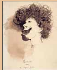
Victor Hugo, Gavroche à onze ans