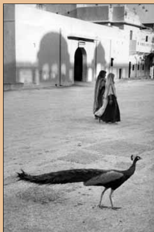
Marc Riboud - Paon de Jaipur, Jaipur, Inde, 1956 - © Marc Riboud