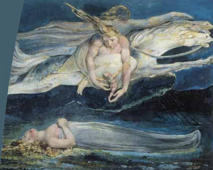
William Blake - The Pity 1795 - Tate Britain - ©Tate, London 2008

Le Cercle a pour objectif de favoriser l'information, le dialogue et le partenariat entre BNP Paribas et ses actionnaires. La vie du Cercle qui complète La Lettre financière, vous propose de participer à des manifestations culturelles, à des formations et à des réunions d'information. L'adhésion au Cercle est automatique pour les actionnaires détenteurs en début d'année, sur un ou plusieurs comptes du même foyer, d'au moins 200 titres BNP Paribas.