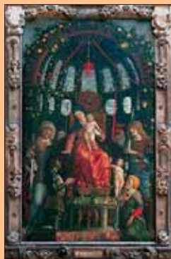
Andrea Mantegna - Isola di Cartura (Vénétie), 1431 Mantoue, 1506 - La Vierge de la Victoire 1496