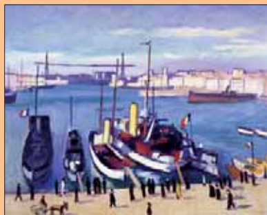
Le Vieux Port et le pont transbordeur, Albert Marquet Huile sur toile - 60 x 81 cm

Pour illustrer les escales maritimes de l'artiste et ses choix stylistiques, pour restituer sur le vif sa