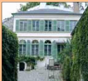
Le Musée de la Vie romantique dans le quartier de la Nouvelle Athènes

Pour en savoir plus : www.vie-romantique.paris.fr