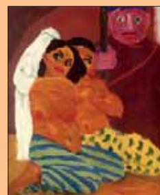
« Nus et eunuque », Emil Nolde - 1912 - Huile sur toile, 88 x 74 cm - Coll. Indiana University Art Museum, Bloomington, États-Unis