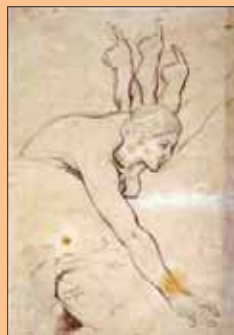
J.-A.-D. Ingres (1780-1867) La mère, nue, avec quatre bras gauches (étude pour le martyre de Saint Symphorien) Mine de plomb et pierre noire (et contour repris à la pointe) sur papier 36,5 x 25 cm