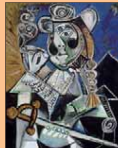
Le Mataador, Pablo Picasso, 4 octobre 1970 Huile sur toile 145,5 x 114 cm Musée Picasso, Paris © Succession Picasso 2008