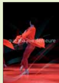
« Que ma joie demeure », Cie Les Fêtes Galantes