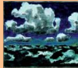
Nuages d'été, (Sommerwolken), Emil Nolde, 1913, Huile sur toile, 73 x 88,5 cm, Musée Thyssen-Bornemisza, Madrid, Espagne