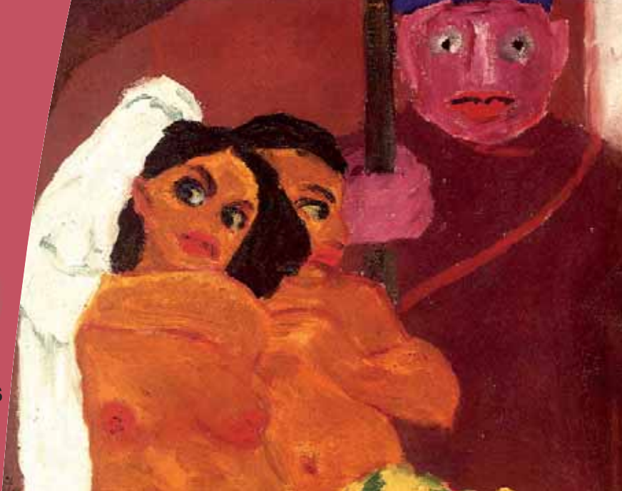
Détail « Nus et eunuque », (Akte und eunuch), Emil Nolde - 1912 Huile sur toile, 88 x 74 cm - Coll. Indiana University Art Museum, Bloomington, États-Unis

Le Cercle a pour objectif de favoriser l'information, le dialogue et le partenariat entre BNP Paribas et ses actionnaires. La vie du Cercle qui complète La Lettre financière, vous propose de participer à des manifestations culturelles, à des formations et à des réunions d'information. L'adhésion au Cercle est automatique pour les actionnaires détenteurs en début d'année, sur un ou plusieurs comptes du même foyer, d'au moins 200 titres BNP Paribas.