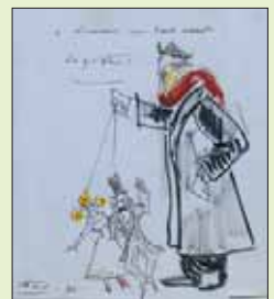
F. Fellini, G. Masina, M. Mastroianni, Ginger et Fred

Date à déterminer ultérieurement, en novembre – n°49